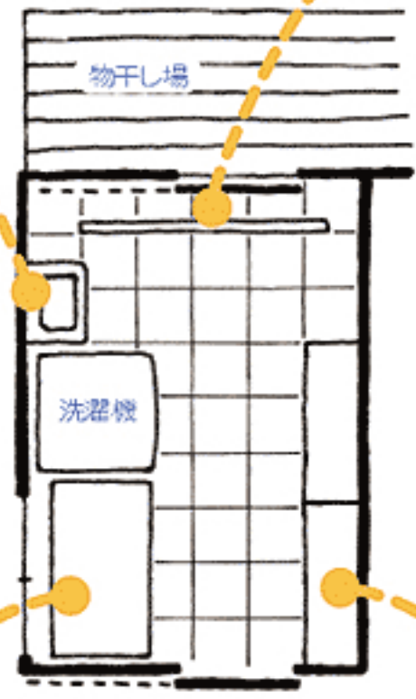
アイデア2～5を1部屋にまとめた例。物干し場の隣に洗濯室をつくると、洗濯物を干したり取り込んだりするのに便利。水がこぼれてもよいように、床はタイル張りに。