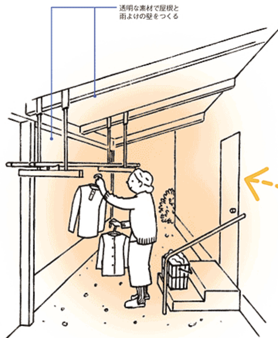
透明な素材で屋根と雨よけの壁をつくる

雨の日の室内干しコーナーをつくっておきましょう。天井に収納し、干すときだけ下ろして使う物干しが便利です。普段の洗濯の際にも、仮干し用の物干しとして活用できます。